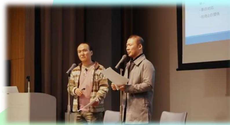
*豊橋市保健所での講演の様子

兄弟として、また、家族としてのそれぞれの思いなど、この間のエピソードを交えてお話していただきます。